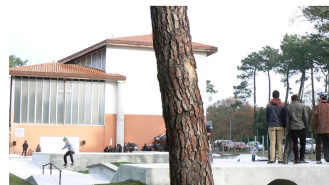
Capitaliser sur l'existant en renforçant l'offre d'équipements pour favoriser l'activité sportive et physique de tous les publics

Le projet vise à accueillir un large public , quel que soit son âge ou son niveau de pratique. Ainsi, l'accès libre à un maximum d'équipements a été privilégié pour permettre à chaque habitant de pouvoir profiter des nouvelles installations. Le niveau d'équipements a été pensé pour augmenter la capacité d'accueil du site et ouvrir son utilisation aux écoles primaires, classes de collège ou centres de loisirs. Le projet a également été conçu pour convenir à un public sportif exigeant . À titre d'exemple, le nouveau skate park répondra aux normes pour accueillir des compétitions d'envergure nationale.