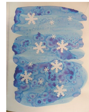
Exemple de productions encre et gros sel.