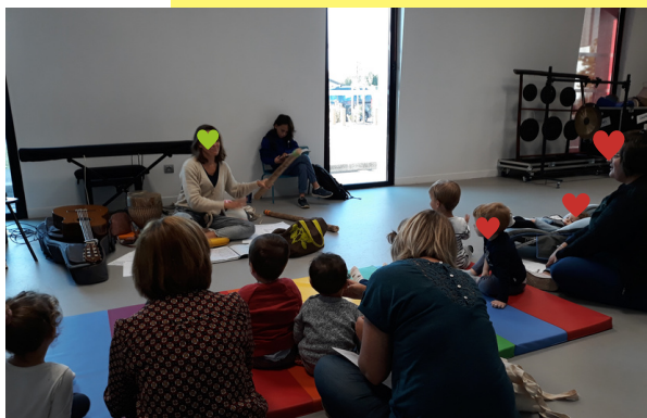
Photo prise lors de la représentation du 30.11.21 à Pôle Sud

En début d'année, les assistantes maternelles du territoire et les enfants accueillis ont participé à des ateliers musicaux animés par les Centres Musicaux Ruraux . Un moment d'échanges et de partage autour des comptines et de la manipulation d'instruments.