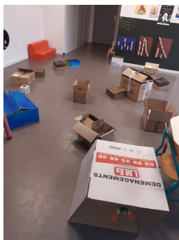
Photos prises lors d'un temps collectif du RAM

Utiliser des grands cartons pour se cacher, pour en faire un tunnel ou encore un véhicule à pousser