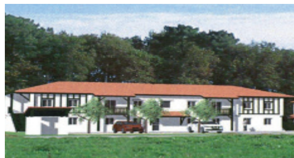
Projet de 4 logements sociaux à Angresse subventionnés en partie par MACS, pour une livraison prévue 1 er trimestre 2020

La production de logement reste toujours soutenue pour répondre aux besoins de la population, notamment des jeunes ménages et des personnes seules. Depuis 2016, plus de 550 logements locatifs sociaux ont été créés , en complément des 500 produits pendant le 1 er PLH (2006-2014). Leur construction a été financée en partie par MACS qui a contribué à hauteur de 1,10 M€. Cette année, ce sont 49 nouvelles opérations qui sont programmées et qui vont bénéficier du financement de MACS, comme à Angresse (4 logements), Capbreton (3 logements), Labenne (6 logements), Saint-Geours-de-Maremne (15 logements), Soustons (7 logements) ou Vieux-Boucau (14 logements).