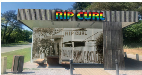
Projet Rip Curl

MACS a souhaité donner l'opportunité à une entreprise locale de mettre en valeur son savoir-faire et de tester un nouveau concept, pour conforter ainsi l'attractivité économique et touristique du territoire. Suite à un appel d'offres, le local devrait être attribué à ADISHATZ. Il est situé à la sortie A63 n°8 de Capbreton, route de Bénésse-Maremne. D'une surface totale de 32 m 2 , il bénéficie en outre d'une terrasse et de facilités de stationnement sur place. Le bail couvre la période du 1 er juin au 30 septembre 2019. Pour la première saison, le loyer saisonnier a été fixé à 150 € par mois (hors charges d'électricité et d'eau) afin de créer des conditions optimales d'installation. Le montant sera réévalué à la hausse les années suivantes.